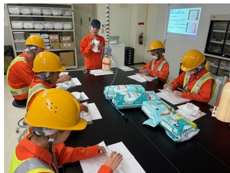
おむつの吸水力を確認する参加者

「将来の夢について考えたい」「理工系の工場に興味があって」「親が勧めたから」など様々な理由でリコチャレに申し込んだ中学生たち。会社紹介のあとは、工場見学と仕事体験へ。VR体験、機械のメンテナンス体験、おむつの品質検査体験の3つのチームに分かれて体験しました。体験後は座談会形式での質問タイムです。