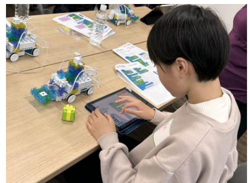
キットを動かすプログラムを設定します

最後はキャタピラーの若手社員も多く参加した座談会。和気あいあいとした雰囲気の中、中学生からは「学生時代に大切な科目は何か」など、将来を見据えた質問も聞かれました。「授業では学べないようなことを学べた」「将来をしっかりと考えたい」といった感想がよせられた今回のリコチャレ。市では、中学生たちが性別にとらわれず自分たちの将来を考えられるよう、今後も応援していきます！