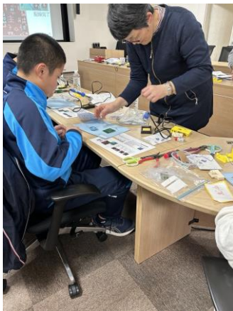
電子工作キット（うそ発見器）を作ります

理工系分野に興味がある中学生を対象に開催しているリコチャレ。今回の会場は、キャタピラー明石事業所です。工場では、ショベルカーの溶接や塗装、組立作業を間近で見学することができました。迫力満点の作業にみんな、興味津々！